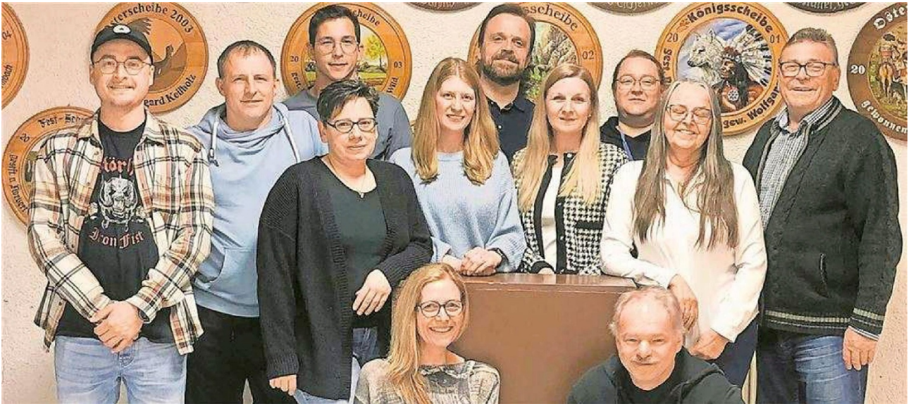
Die Theatergruppe Oberkrumbach.

KOMÖDIE Die Laienschauspieler der Oberkrumbacher Schützen treffen mitten ins Zwerchfell.