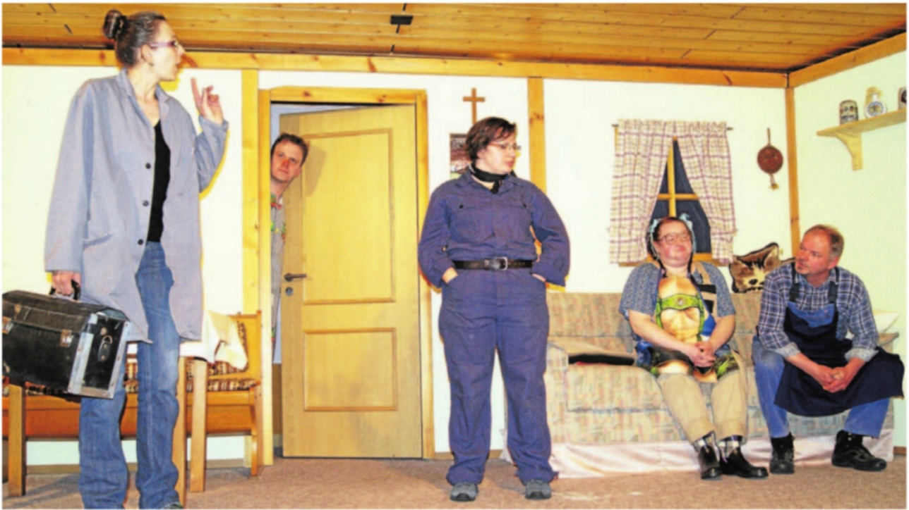
Max (an der Tür) belauscht ein Gespräch mit Gemeindeschwester Agathe (l.), bei dem es um den besorgniserregenden Gesundheitszustand von Zuchteber Schorsch geht (v. r.: Vater Franz, Magd Bruni und Rosa).