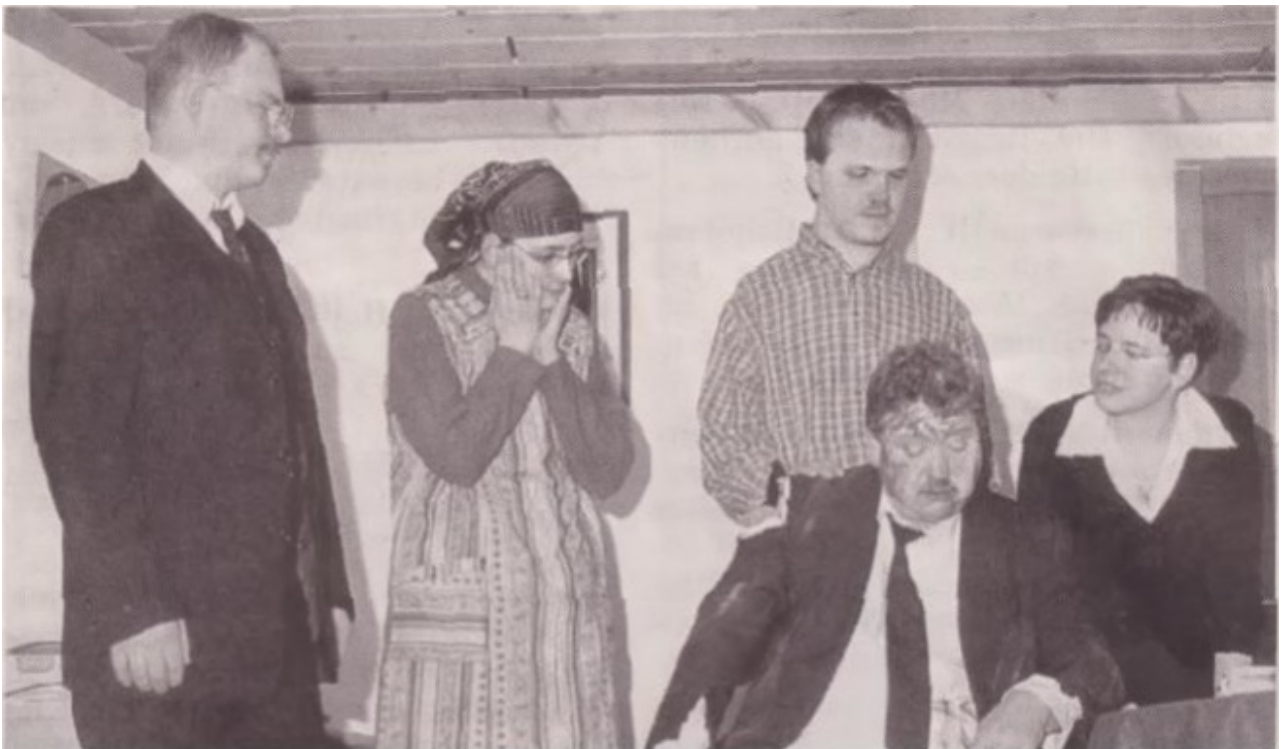
Viel Stress für Bürgermeister Pechleitner in Oberkrumbach.