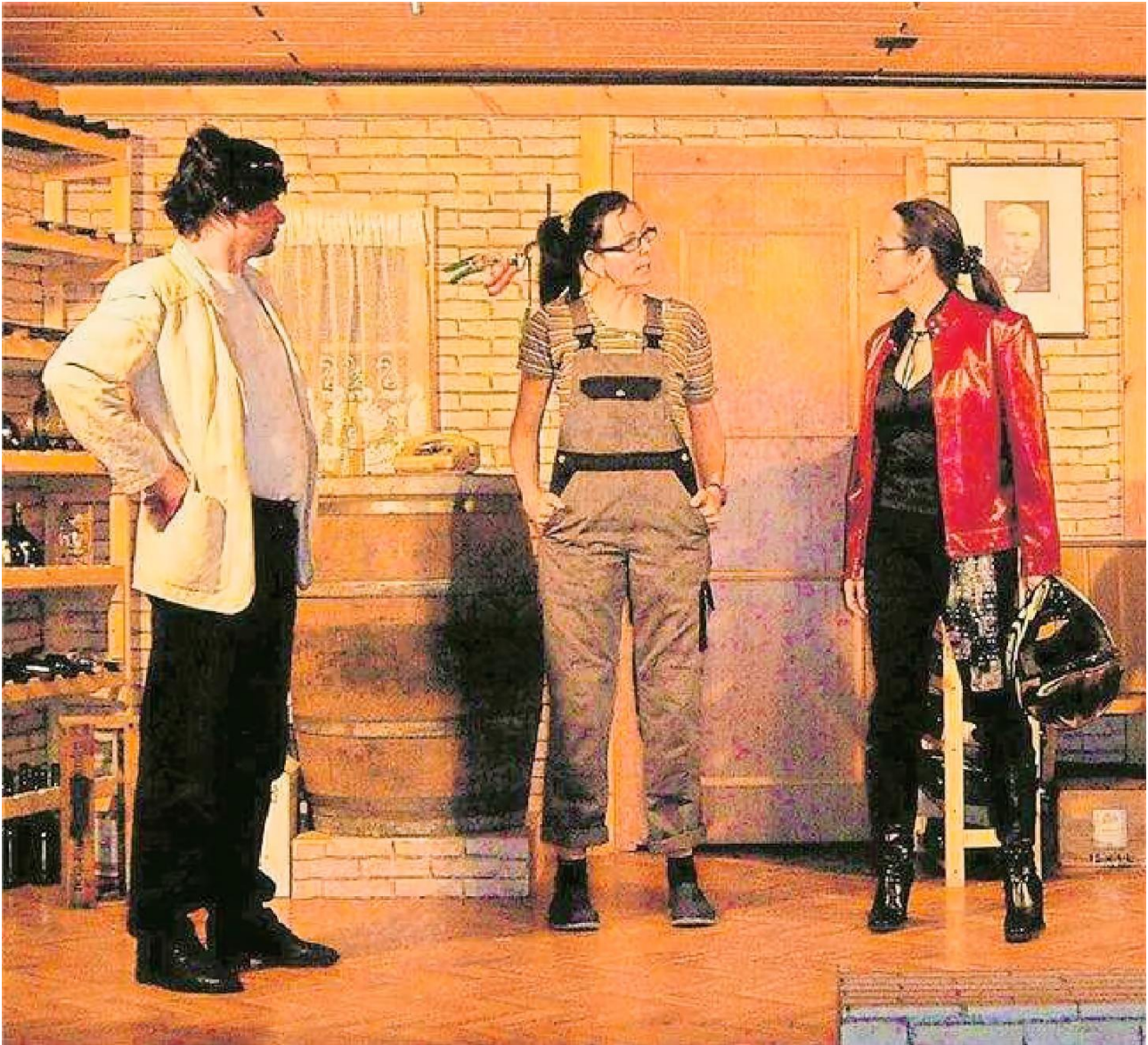
Die Oberkrumbacher Theatergruppe spielt 2008 „Das verrückte Gut Weinstein“.

Auch Kulissen und Requisiten werden von allen gemeinsam zusammengestellt. Bei der Premiere des aktuellen Stücks „Ne Macke hat doch jeder!“ sind auch die drei wieder dabei. Man wird nicht merken, dass das Ensemble sich schon seit Monaten auf die Aufführungen vorbereitet hat, dass viele fleißige Helfer sich um Licht und Bühne gekümmert haben, dass weitere freiwillige Oberkrumbacher dafür sorgen, dass es Getränke und einen Imbiss gibt und dass nach der Vorstellung jemand aufräumt, putzt und alles wieder an seinen Platz stellt. Und so soll es auch sein.