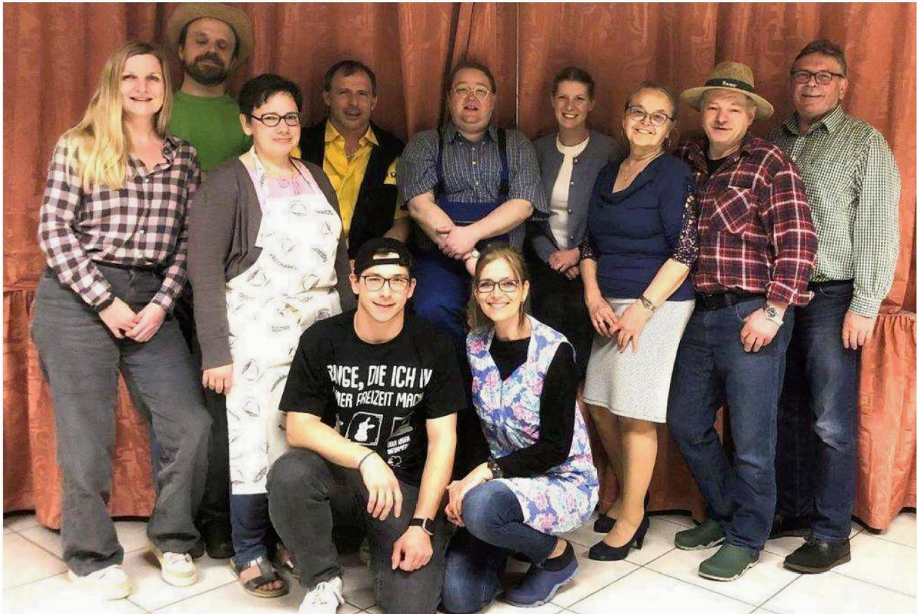
Die Oberkrumbacher Theatergruppe.

Komödie: Die Oberkrumbacher bringen ein Verwirrspiel mit Langohr auf die Bühne.